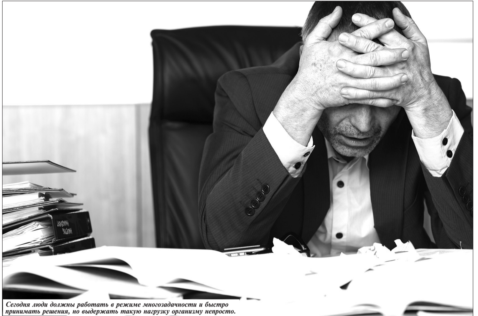
Сегодня люди должны работать в режиме многозадачности и быстро принимать решения, но выдержать такую нагрузку организму непросто.

Как хотят нас избавить от общих и профессиональных болезней?