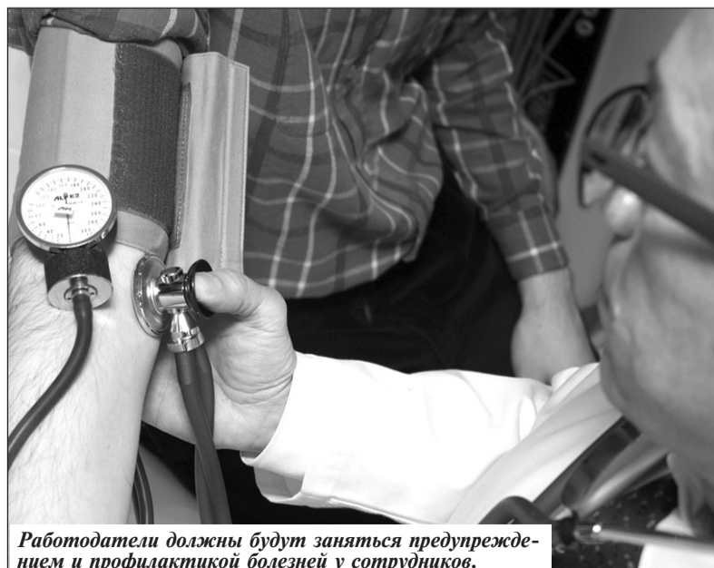
Работодатели должны будут заняться предупреждением и профилактикой болезней у сотрудников.

Андрей ВЕСЛОВ.