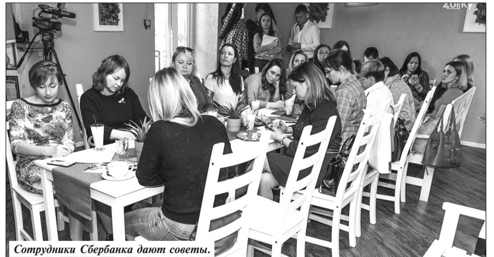
Сотрудники Сбербанка дают советы.

Проект «Наставничество» координируется Центром развития предпринимательства Брянского областного Центра оказания услуг «Мой бизнес».